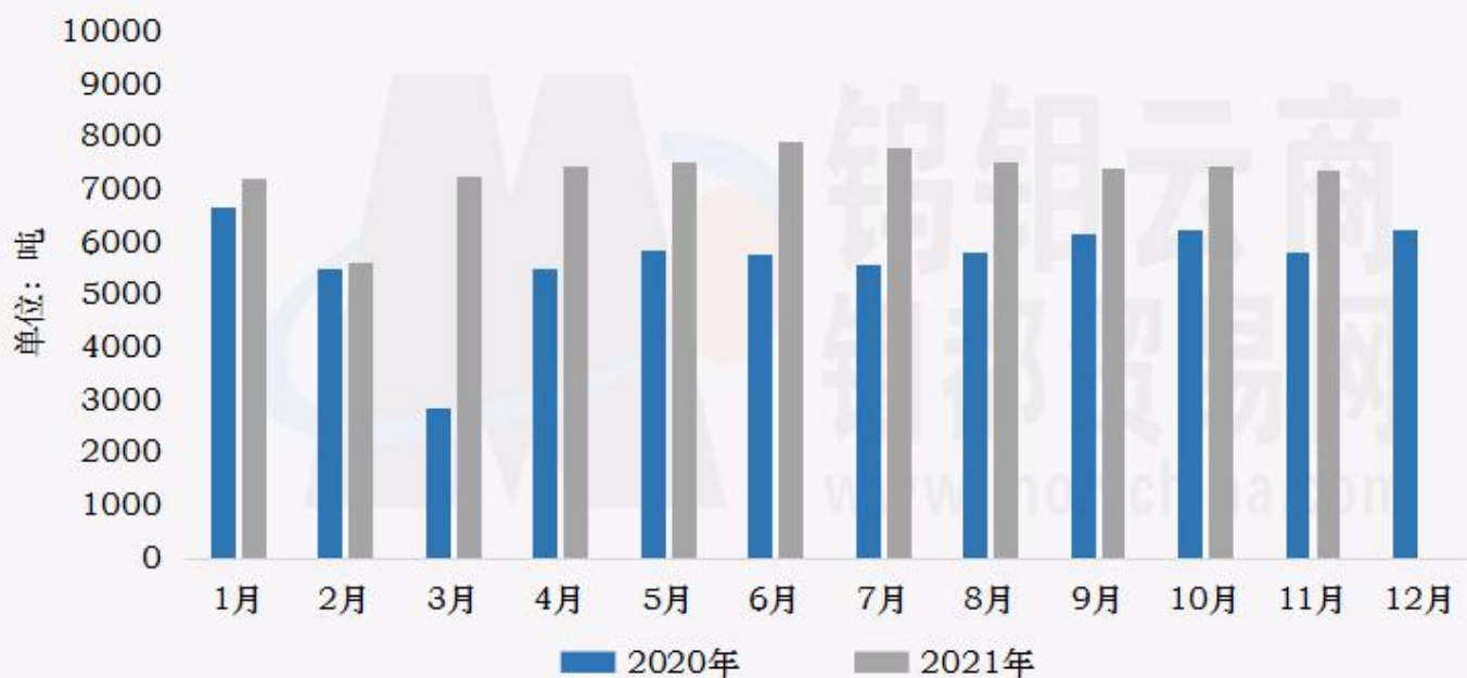
钨钼云商：2020/2021年钨粉末月度产量对比