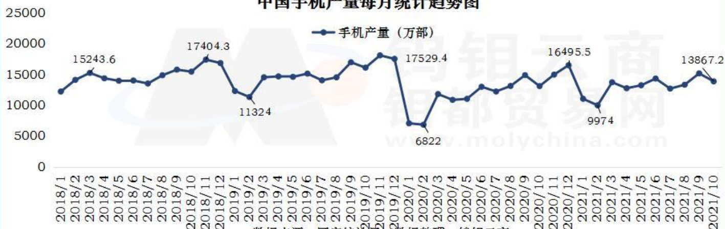
中国手机产量每月统计趋势图