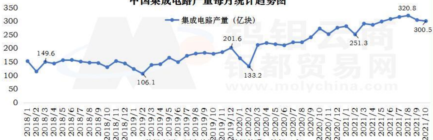
中国集成电路产量每月统计趋势图