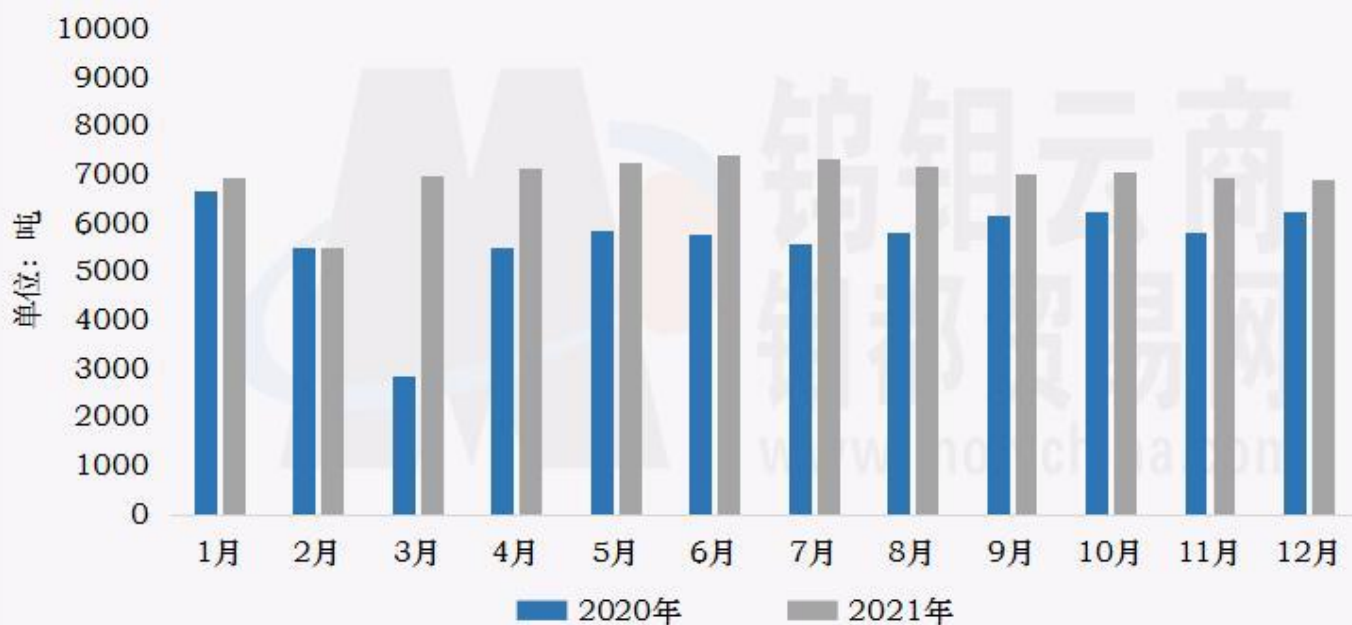
钨钼云商：2020/2021年钨粉末月度产量对比