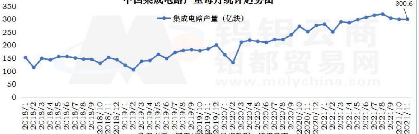
中国集成电路产量每月统计趋势图