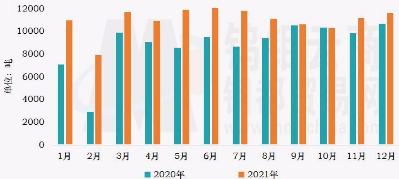
钨钼云商：2020/2021年APT月度产量对比