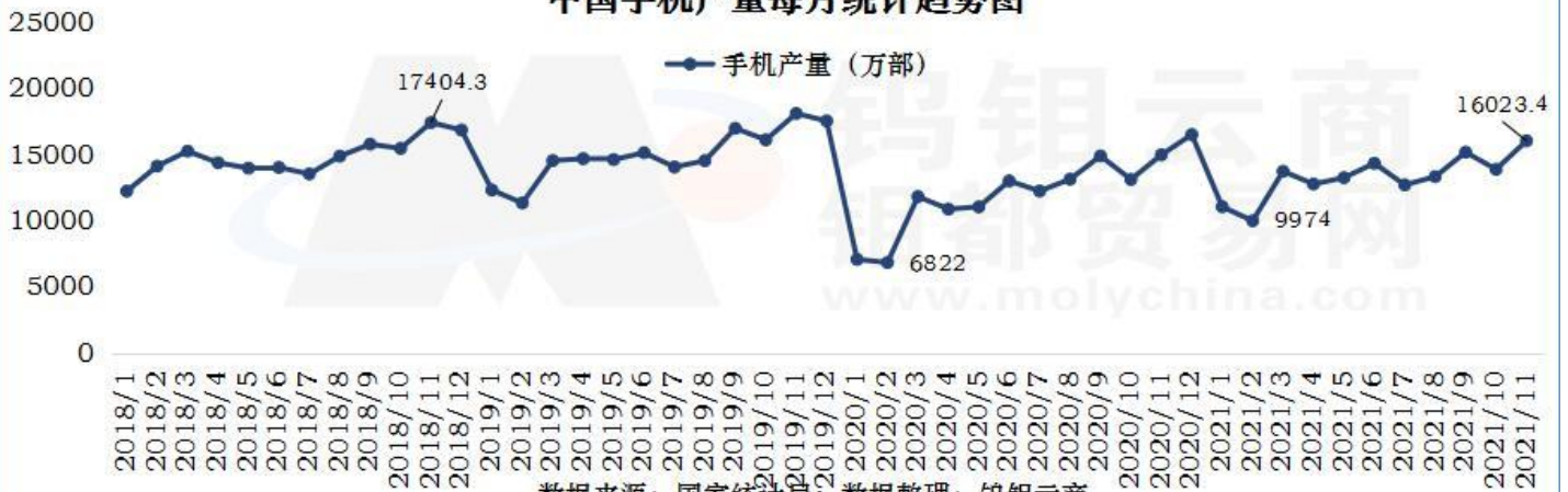
中国手机产量每月统计趋势图